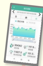
iCareAI 健康智能 App